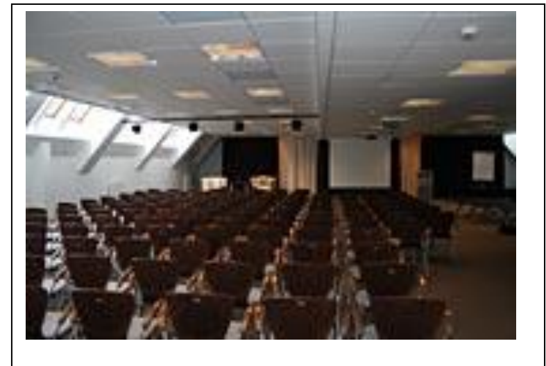
SALA WYSTAWOWA 250 m 2 , BUDYNEK A, 5 PIĘTRO